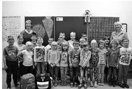
Die Klasse 1 der Evangelischen Grundschule St. Martin.