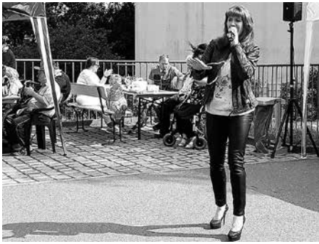
Am 18. August 2017 wurde im Kursana Domizil Meerane Sommerfest gefeiert. Unter anderem gab es hier eine „Andrea-Berg-Covershow“ zu erleben.