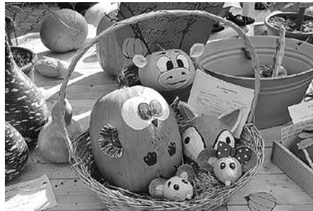
Kürbisausstellung zum Kürbisfest 2016. Ist 2017 auch Ihr Kürbis mit dabei?

am 23. und 24. September im A4-Center vorbei und feiern Sie mit uns das 19. Meeraner Kürbisfest!“