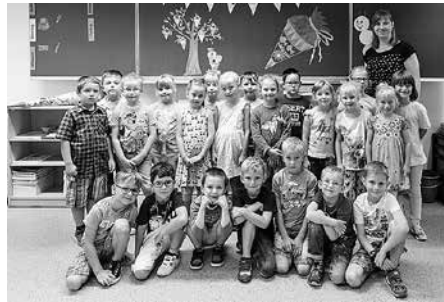
Die Klassen 1a und 1b der Grundschule Lindenschule.