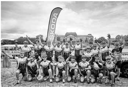
Das Radteam Steile Wand war mit 20 Teilnehmern, darunter auch zwei Frauen, beim ŠKODA Velorace Radrennen in Dresden dabei. Alle absolvierten die 105 Kilometer-Distanz.