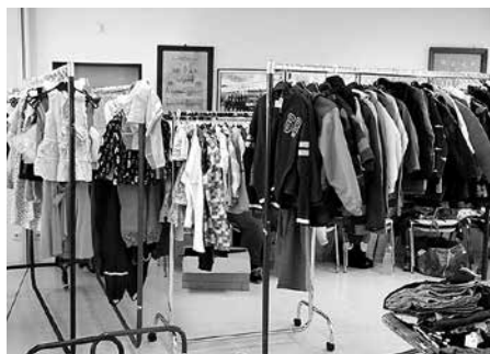
Der Nachwuchs ist aus den Sachen herausgewachsen? Am 9. September 2017 findet die nächste Kinderkleiderbörse des Feuerwehrvereins Meerane statt.

Das Organisationsteam freut sich auf viele Gäste zur Herbstkleiderbörse!