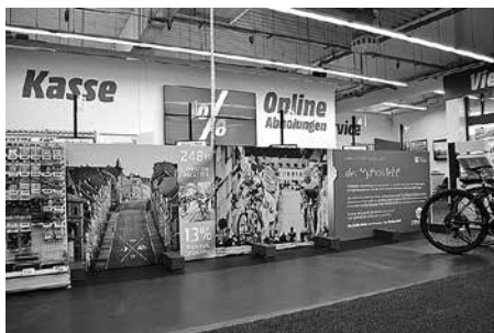
Eine Fotowand wirbt im Media Markt Meerane für die Steile Wand.