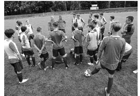
Mannschaftscoaching der C-Jugend