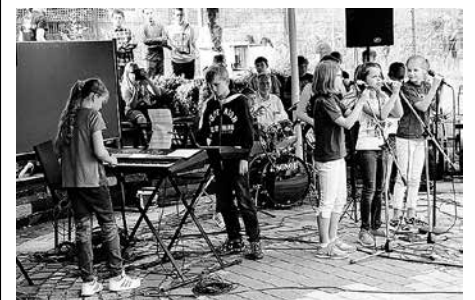
Schulfest zum Schuljahresabschluss am Europäischen Gymnasium Meerane.