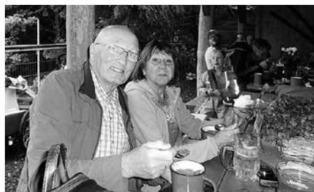
MBV-Wanderung am 13. August 2017: Am Start waren die Regenschirme mit dabei. Gerastet wurde in der „Alm“ am Totenstein.