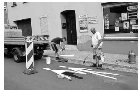
Der Abschnitt von der Chemnitzer Straße bis zur Lindenschule wird als „Strecke 30“ ausgewiesen.