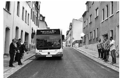
Der erste Bus bekam eine La-Ola-Welle und passierte danach problemlos den Anpassungsbereich erster und zweiter Bauabschnitt.