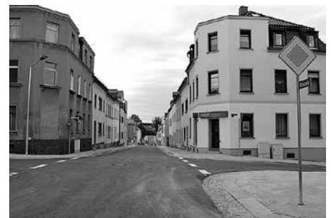
Der jetzt fertiggestellte Straßenabschnitt reicht von der Böhmerstraße bis einschließlich Kreuzung Südstraße.