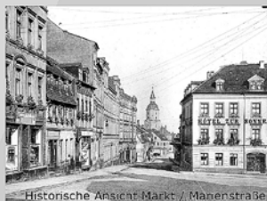
Historische Ansicht Markt / Marienstraße