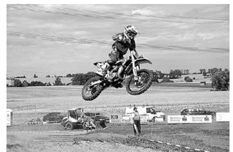
Motocross am 5. und 6. August in Tettau. Der MC Meerane veranstaltete seine Clubmeisterschaft und Läufe zur Sachsenmeisterschaft.

„Das Resümee des Wochenendes war äußerst positiv. Der wohl kleinste Verein hat es wieder geschafft, seinen Gästen ein unvergessliches Wochenende zu präsentieren. Unser Dank geht dabei an alle Helfer, besonders an die Streckenposten, Sponsoren und Zuschauer, ohne die die Veranstaltung nicht möglich gewesen wäre. Bis zum nächsten Jahr!“, so der MC Meerane.