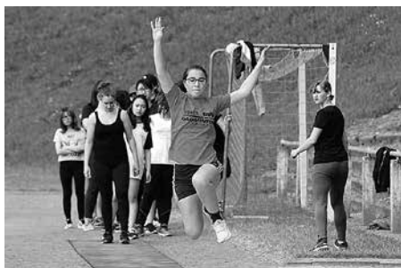
Sportlicher Höhepunkt zum Schuljahresabschluss im Europäischen Gymnasium: Das Leichtathletik-Sportfest.