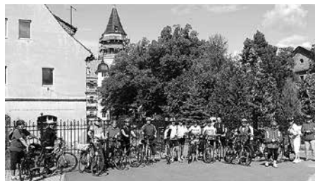
Die MBV-Radwanderfreunde vor dem Schloß Ehrenberg.

Am 20. August 2017 trafen sich 18 Radler der Radwandergruppe des Meeraner Bürgervereins (MBV) bei strahlendem Sonnenschein auf dem Meeraner Markt, um die Tour ins Altenburger Land in Angriff zu nehmen.