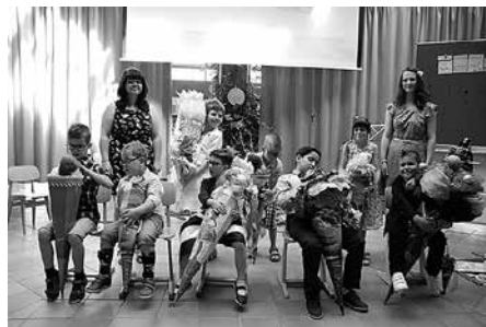
Schulanfang der neuen Unterstufe 1 der Förderschule Dr.-Päßler-Schule Meerane.