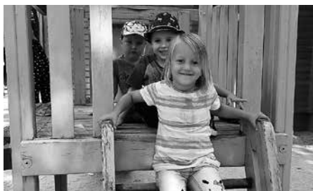
Die Glühwürmchen-Gruppe aus dem Kindergarten Rosarium besuchte den Inselzoo in Altenburg.