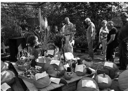
Ein Besuchermagnet bei jedem Meeraner Kürbisfest: Die Kürbisausstellung im Gartencenter Dehner.