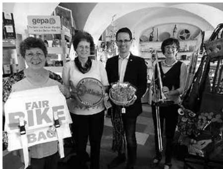
Oberbürgermeister Stefan Czarnecki beim Besuch im Weltladen.