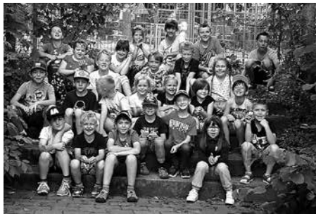
Mit Mitarbeitern des Stadtteil-Managements Unterstadt-Mulde Glauchau erlebten die Mädchen und Jungen vom Hort an der Lindenschule am 5. Juli 2017 einen Stadt-TEILrundgang unter dem Motto „verstrickt und zugenäht“.