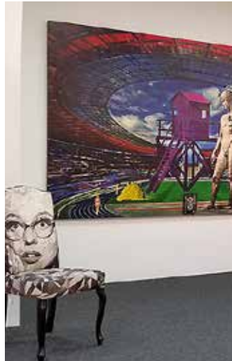
Die Galerie ART IN zeigt bis 10. September Arbeiten von Thomas Beurich.