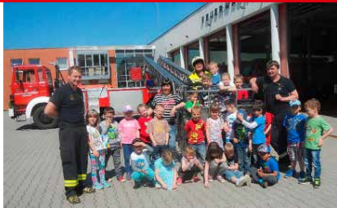
Vorschulkinder aus der Kindertagesstätte „Buratino“ zu Besuch in der Meeraner Feuerwache.