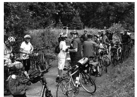
Die Radwandergruppe des Meeraner Bürgervereins war am 23. Juli in der Fränkischen Schweiz unterwegs.

Am 23. Juli 2017 stand der Höhepunkt der Radwandersaison 2017 der Radwandergruppe des Meeraner Bürgervereins bevor – die Bus-Radtour nach Bayreuth mit einem Rundkurs durch die Fränkische Schweiz. 21 Radlerinnen