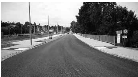
Am 19. Juli 2017 wurde die Deckschicht aufgebracht.