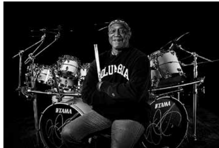
Billy Cobham wird neben vielen weiteren Künstlern in der neuen Theater-Saison im Crimmitschauer Theater auftreten.

nen Karten bereits früher erworben werden – ab 7. August an der Theaterkasse (Mo bis Do 14:00–19:00 Uhr, Fr 09:00–12:00 Uhr; Tel. 03762 47888).