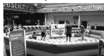
Besuch der Trampolinhalle „Jumphouse“ Klasse 9

stand unter dem Schwerpunkt „Migration in der Geschichte“. Aufgelockert wurde die Woche durch zwei Besuche in Leipzig. Ein Wunschziel der Schüler war die Trampolinhalle „Jumphouse“. Trampoline aller Art wurden ausgiebig getestet, zum großen Vergnügen aller Beteiligten. Am Donnerstag folgte dann ein Ausflug ins Belantis, bei dem besonders die Achterbahnen beansprucht wurden. Die Zeugnisausgabe, bei der den meisten Schülern und Schülerinnen gute und sehr gute Ergebnisse bescheinigt werden konnten, krönte diese ereignisreiche Woche und ein ereignisreiches Schuljahr.