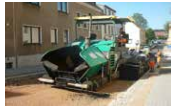
Oststraße (2. Bauabschnitt): Asphaltarbeiten 4. bis 9. August.