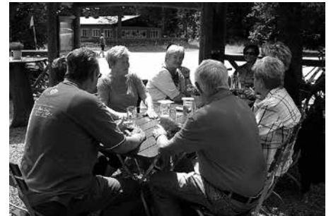
Einkehr in Weidmannsruh.