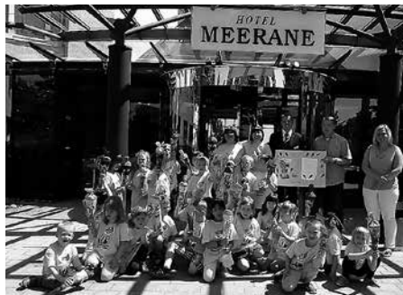
Einen Zuckertütenbaum fanden die Vorschulkinder aus dem Kindergarten „Buratino“ im Hotel Meerane.

zieher, Eltern und die Volkssolidarität möchten daher ganz herzlich Danke sagen! Ein besonderer Dank gilt auch dem Garten-Center Dehner für die reich gefüllten Zuckertüten! Im Anschluss an den Besuch im Hotel Meerane wartete noch ein aktionsreicher Nachmittag auf unsere Mädchen und Jungen und natürlich die traditionelle Übernachtung im Kindergarten! Vielen Dank an alle für diesen schönen Tag!“