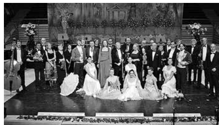
„Die große Johann Strauß Gala“ ist am 14. Oktober in Meerane zu erleben. Der Kartenvorverkauf läuft.

Eintrittskarten zum Vorverkaufspreis von 19 Euro, 26 Euro, 30 Euro, 34 Euro sind unter anderem erhältlich in der Buchhandlung Goerke am Meeraner Markt, Tel: 03764 4673, und angeschlossenen Vorverkaufsstellen. Weitere Informationen erhalten Interessenten unter www.strauss-gala.de