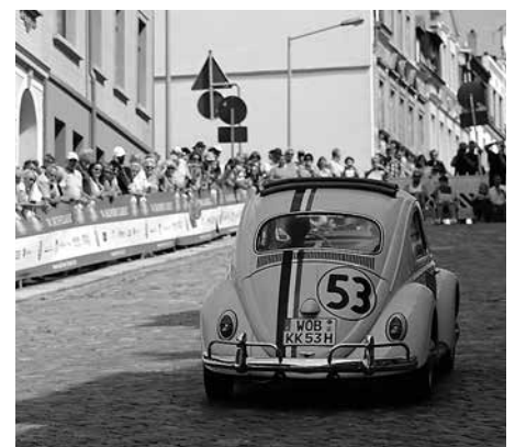
Am 17. August 2017 kommt die 15. Sachsen Classic wieder nach Meerane!

Von der Steilen Wand aus führt die Tour über Dittich (12:30 Uhr) zum Schloss Rabenstein und über Chemnitz und den Sachsenring wieder zurück nach Zwickau.