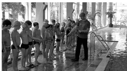
Auch im vergangenen Schuljahr ging es für die Zweitklässler regelmäßig zum Schwimmunterricht.

Für die Zweitklässler der Evangelischen Grundschule St. Martin Meerane steht bereits seit mehreren Jahren der regelmäßige Schwimmunterricht auf dem Stundenplan. „Trotz herausfordernder Verhältnisse hat unser Träger seit mehreren Jahren gute Bedingungen für unsere Zweitklässler geschaffen. Der Schwimmunterricht findet regelmäßig in der Schwimmhalle des Krankenhauses Glauchau statt. Dieser logistische und finanzielle Aufwand hat sich gelohnt: Aktuell können alle unserer Zweitklässler aus dem vergangenen Schuljahr sicher schwimmen. Viele haben Schwimmleistungen abgelegt, die zum Erwerb des Abzeichens in Bronze oder Silber berechtigen“, informiert Ramona Peter von der Evangelischen Grundschule.