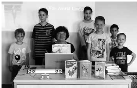
In der Ferienveranstaltung am 11. Juli in der Kinderbibliothek stand die Schriftstellerin Astrid Lindgren im Mittelpunkt.