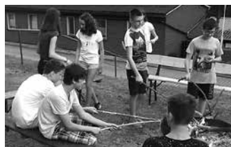
Gemeinsames Grillen Klasse 8 in Plau

es das Wetter sehr gut (manchmal fast zu gut) mit uns. Und siehe da: Das Shoppengehen war plötzlich von allen vergessen und wir entdeckten gemeinsam viele (für manche neue) Freizeitmöglichkeiten.