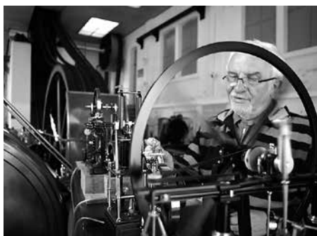
Am 21. und 22. Oktober finden die Werdauer Dampf Tage im Stadt- und Dampfmaschinenmuseum statt.

Ähnlich ist das auch acht Wochen später. Am 21. und 22. Oktober werden zu den Werdauer Dampf Tagen wieder hunderte Bastler und Fans kleiner, rauchender und schnaufender Maschinen erwartet. Sie kommen traditionell aus dem ganzen Bundesgebiet und präsentieren ihre Schmuckstücke täglich von 10:00–18:00 Uhr dem staunenden Publikum.