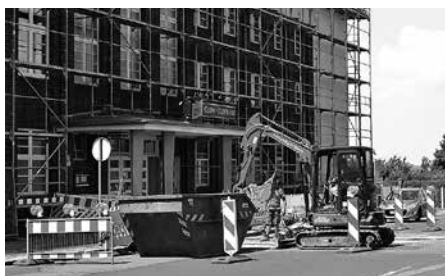
Auch im Straßenbereich vor der Stadthalle wurde gebaut – im Zuge der Erneuerung der Dachentwässerung wurde hier die Anbindung an den Abwasserkanal erneuert.