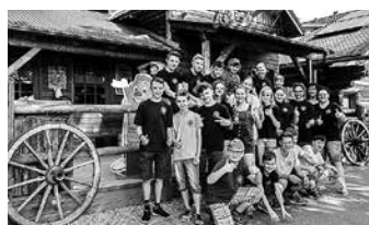
Klassenfahrt der Klasse 7 zum Europapark Rust

diesen fantastischen Gewinn! Es war toll! Die Klasse 7 IOM.