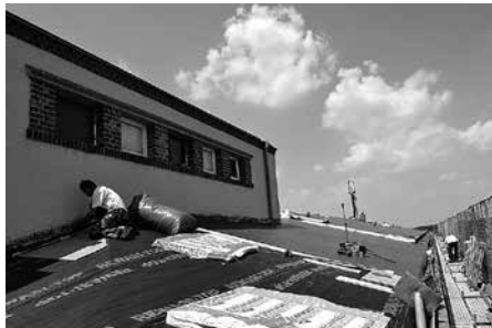
Das Dach der Meeraner Stadthalle wurde mit einer Abdichtfolie mit Gewebeverstärkung neu abgedichtet.

Anfang August 2017 waren die Arbeiten dann abgeschlossen.