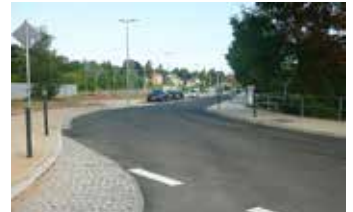
„Umgestaltung des Geländes entlang der Bahn“ (1. Bauabschnitt): Verkehrsfreigabe am 4. August.