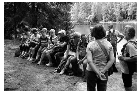
Rast am Stauweiher.