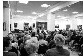
Viele interessierte Gäste wurden zur Vernissage am 26. Juli 2017 begrüßt.