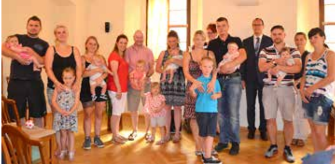
Übergabe der „Willkommenspakete für Meeraner Neugeborene“ am 31. Juli im Alten Rathaus.