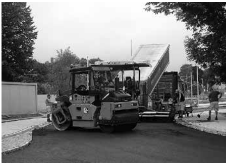
Beginn der Asphaltarbeiten am 17. Juli 2017.