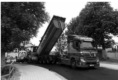
Beladen des Fertiglers mit heißem Asphalt.