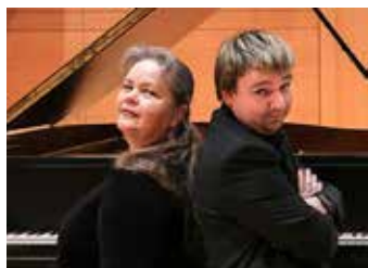
„DuoSassoni“ gastiert am 10. Februar 2017 in der Galerie ART IN.