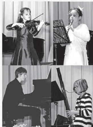
Aus dem Wettbewerb 2010