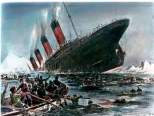
Sinkende Titanic. Gemälde von Willy Stöwer, 1912