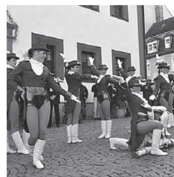
Wie in jedem Jahr zum Karnevalsauftakt dabei: Die Gardemädchen vom Meeraner Tanzboden e.V.