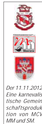
Der 11.11.2012: Eine karnevalistische Gemeinschaftsproduktion von MCV, MM und SM.