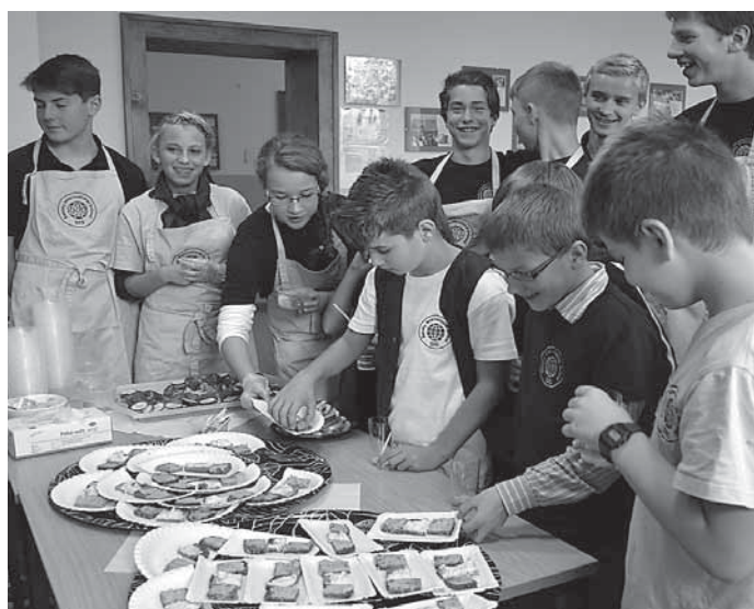
Die Schülerinnen und Schüler der 9. Klasse der IMM hatten ein gesundes, leckeres Pausenfrühstück für alle Schüler vorbereitet.

Im Rahmen der Veranstaltung wurden auch die Ergebnisse des Schulmensa-Checks präsentiert. Dass diese Ergebnisse ernst genommen werden, bewies Thomas School als Geschäftsführer der GGB und damit auch für die Essensversorgung der IMM zuständig.