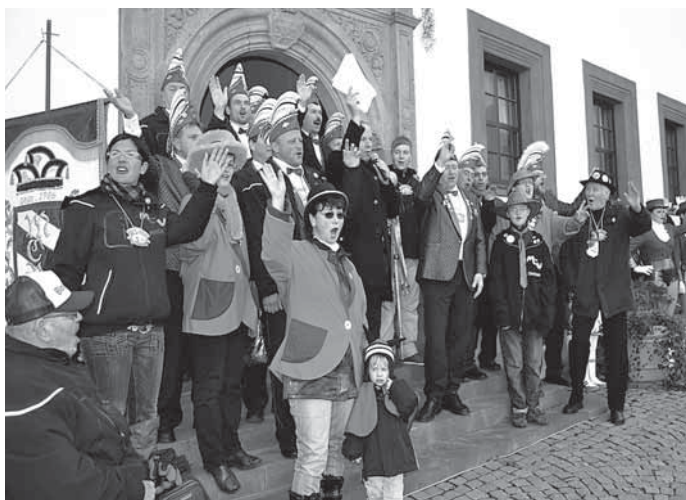
Am 11.11., 11.11 Uhr, sind wieder alle Närrinnen und Narren auf den Meeraner Markt eingeladen. Der MCV hofft auf einen reibungslosen Machtwechsel.

Herzlich eingeladen sind daher alle Meeraner Närrinnen und Narren und alle närrischen Gäste unserer Stadt am 11.11., um 11.11 Uhr auf den Meeraner Markt. Es gibt Musik mit den Meeraner Schalmeien und den Guggemusiken „Rasselbande“