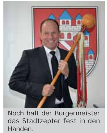
Noch hält der Bürgermeister das Stadtzepter fest in den Händen.

„Mehr Meerane“ und Bürgermeister sind jedoch übereingekommen, den MCV-Narren nach der Übergabe des Stadtzepters als erste Amtshandlung die Enthüllung und Einweihung des neuen Marktplatz-Brunnens zu übertragen. Damit lüftet sich das Geheimnis des weißen Zelt. Dass an diesem 11.11. aus dem