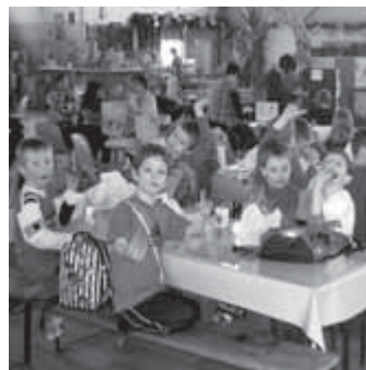
Der Besuch in der Schatzhöhle kam bei den Kindern toll an.

Danke sagt das Team vom Hort „Buratino“. St. Sonntag