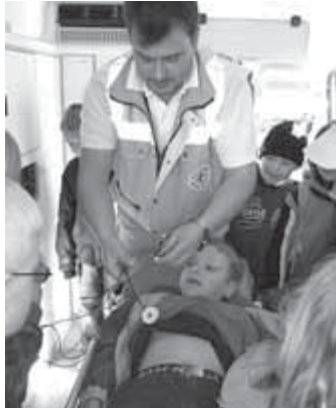
Bereits im Vorjahr waren die Kinder beim Thema „Erste Hilfe“ begeistert bei der Sache.

Leider können die vielen guten Ideen nicht umgesetzt werden, da Bürokratie und Kosten immer wieder ihre Hände darauf halten. Aber ein Erzieher wäre kein Erzieher, wenn er nicht erfinderisch wäre. Somit ist es uns doch ge-