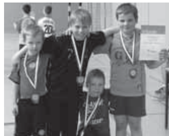
Den 1. Platz bei den 7- bis 11-Jährigen holten die Teufelskicker der Annaparkhütte.

Die mitgereisten Fans, Eltern, Kinder und Betreuer aus dem Hort Buratino sahen dann sehr emotionale Spiele mit engagierten Spielern. Es wurde hart, aber fair gekämpft, wobei auch eine Mittagspause mit einem kleinen Imbiss zur Stärkung beitrug. Bei der abschließenden Siegerehrung erhielten alle Spieler eine Medaille sowie eine Urkunde für das Team. Ein jüngerer Spieler